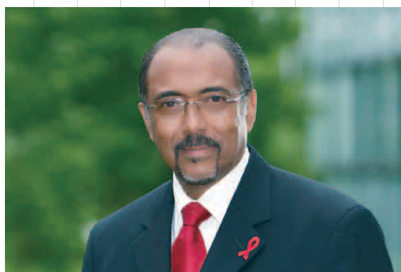
ミシェル・シディベ氏